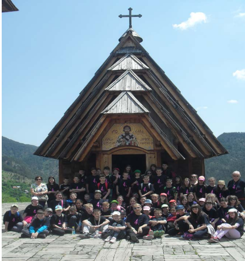
ДРВЕНГРАД!!!! И сви смо ТУУУ!!!