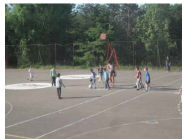
... игре, мало...