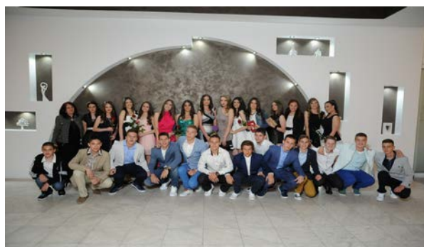
ОСМО - ТРИ