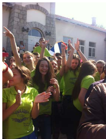
ВЕСЕЛА ДРУЖИНА ГЕНЕРАЦИЈЕ 2007/2015.година