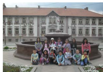
.... шетње и историје.....