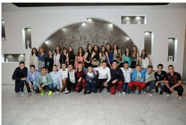
ОСМО - ПЕТ