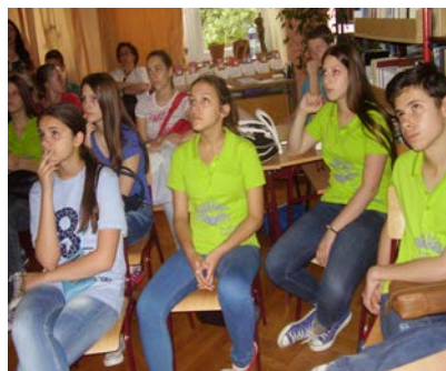
ПУБЛИКА И ПРЕДАВАЧ