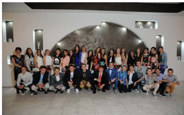
ОСМО - ЈЕДАН