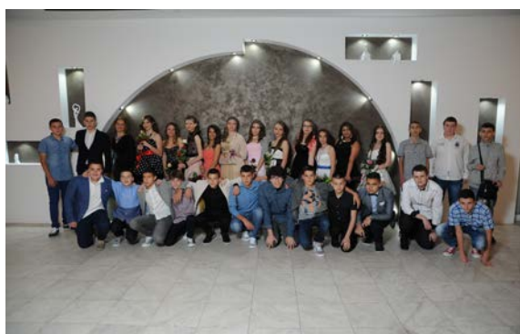
ОСМО - ШЕСТ