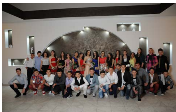
ОСМО - ДВА