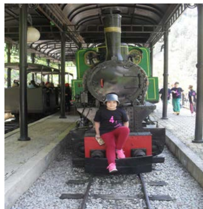
Погодите КО ВОЗИ ОВАЈ ВОЗ ?....