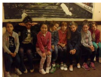
... забаве, мало...