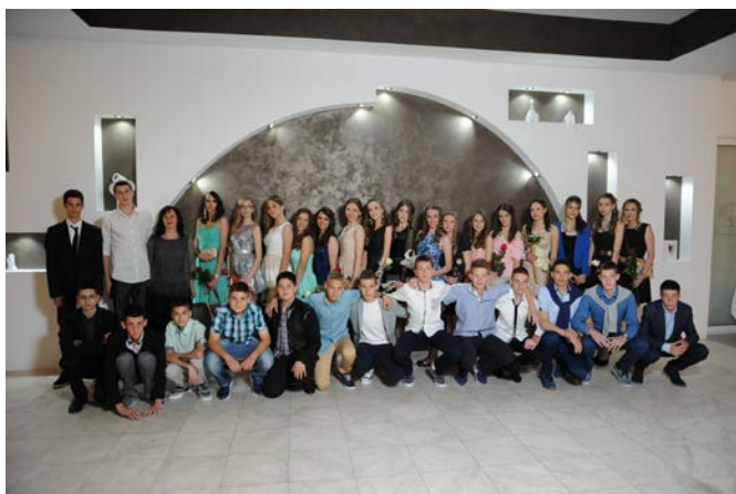
ОСМО - ЧЕТИРИ